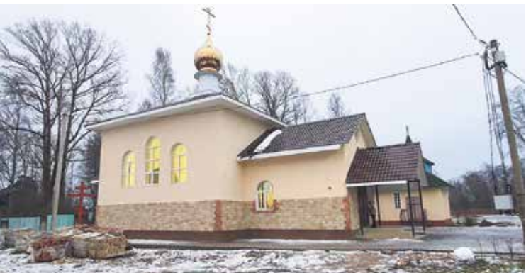
Храм в честь Святителя Спиридона Тримифунтского в деревне Борисова Грива