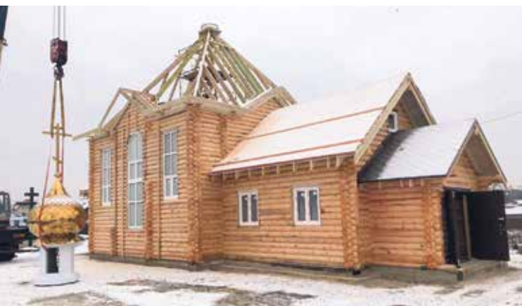
Храм в честь Апостола Андрея Первозванного в поселке Красная Заря