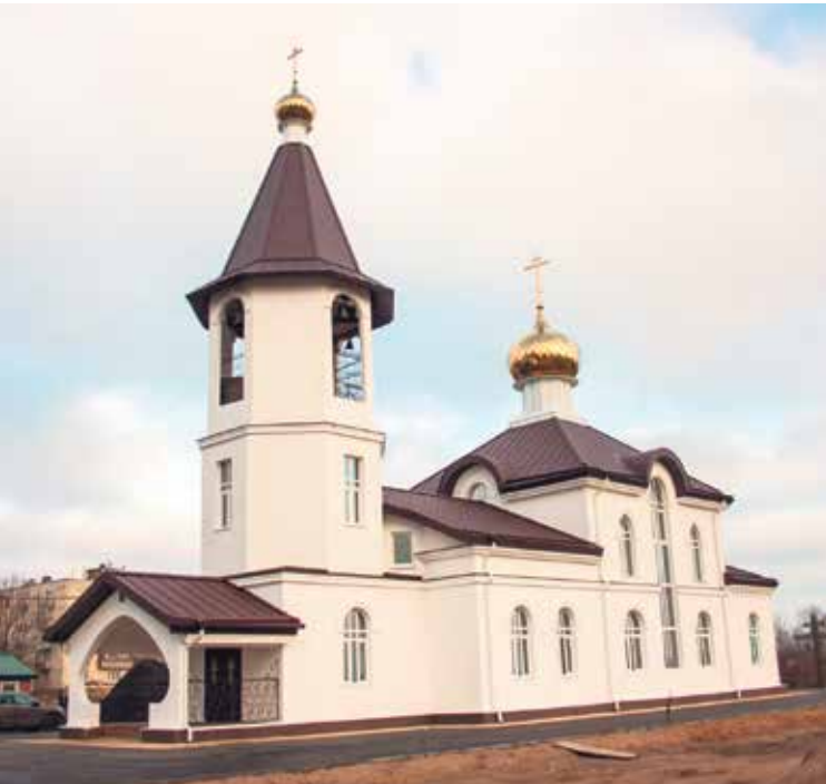
Храм в честь Святого благоверного князя Александра Невского в поселке Романовка