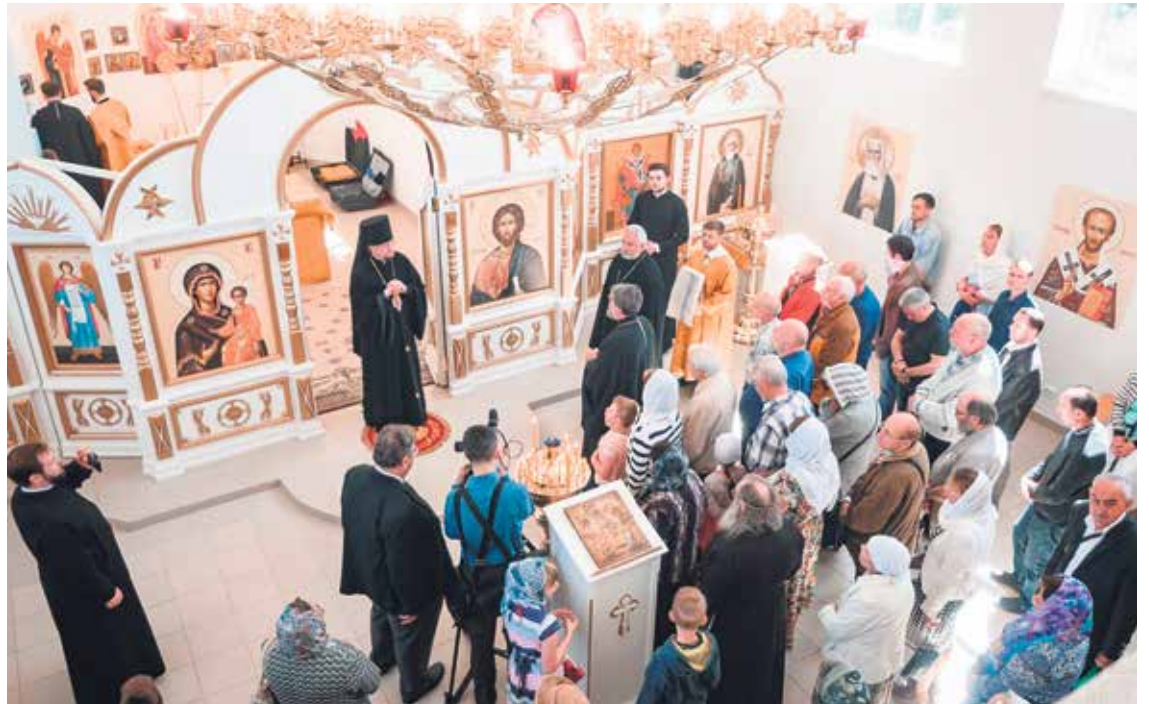
Большое освящение храма в деревне Борисова Грива