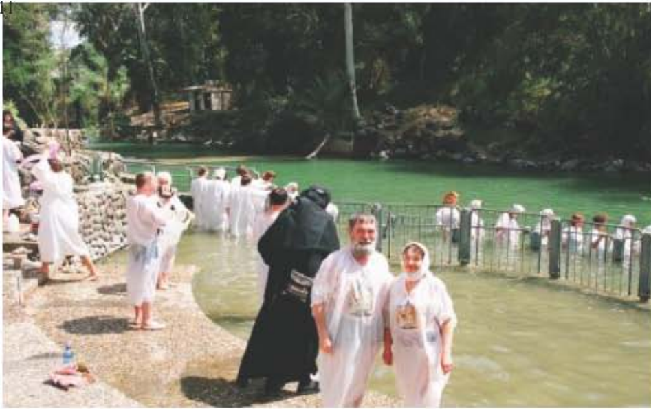
4.04.08 Купание в Иордане