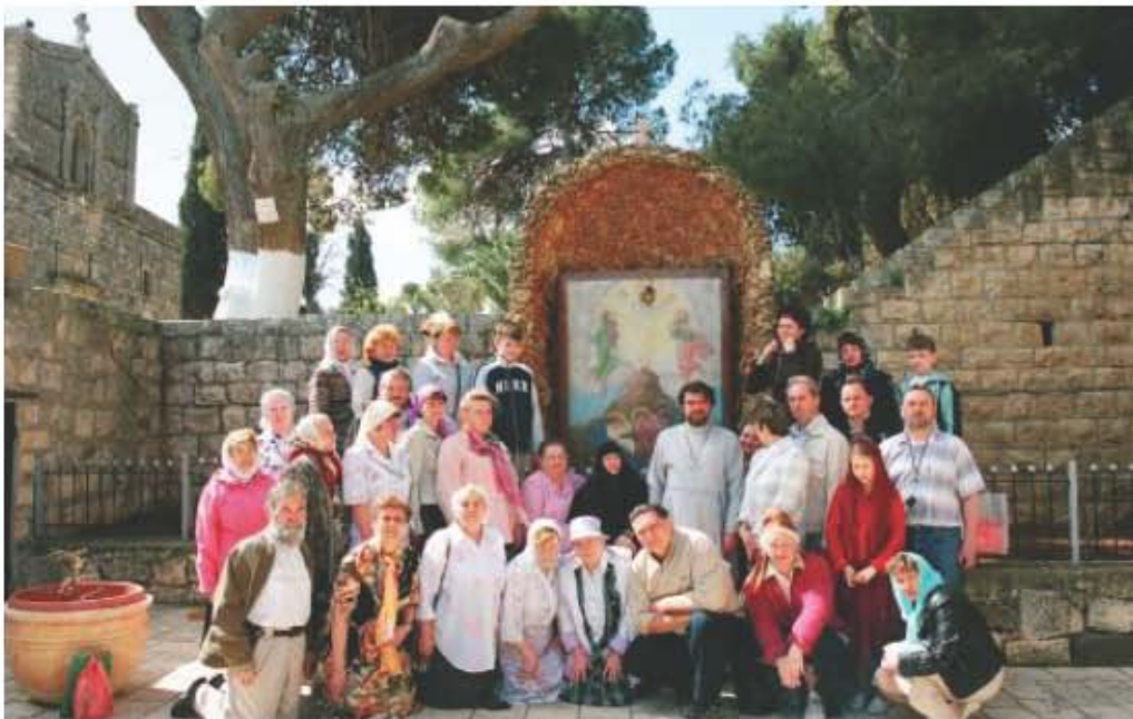
4.04.08 Снимок на горе Фавор, месте Преоб- ражения Гос- пода.