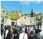
Назарет. Храм Архангела Гавриила.

Снон-горница Тайной Вечери, в этой горнице Иисус с учениками совершил последнюю тра