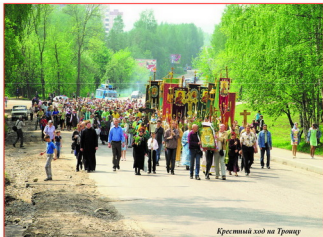
Крестный ход на Троицу