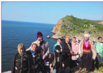
30.04.08 Паломники в Балаклаве

В Пасху, 27 апреля 2008 года группа паломников и прихожан храма на Дороге Жизни в составе 65 человек оккупировала два вагона поезда Петербург – Севастополь и отправилась в Крым. На этой странице фотографии из поездки.