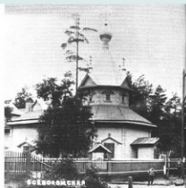
Троицкий храм в начале XX века

В плане церковь похожа на крест: восьмигранный восточной части соединяется с основным залом и дополняется двумя боковыми приделами - северным и южным. Сверху церковь перекрыта восьмигранным куполом со световым барабаном. Над ним - шатер с главкой. Небольшие дополнительные главки вокруг основного барабана и над приделами, а также невысокая