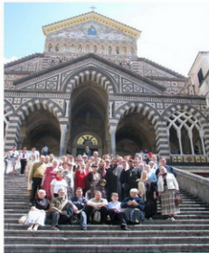
У храма Андрея Первозванного в городе Амальфи