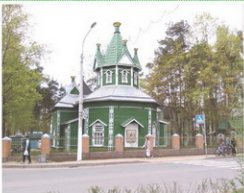
Троицкий храм сегодня

Весной 2001 года из-за неисправной электропроводки в храме начался пожар. Огонь погасили, но церковь пострадала от огня и воды. Так и было написано в обращении к прихожанам, что висело в те дни у ограды: «Братья и сестры, наш храм пострадал!» Пострадал... Сказано, словно о нуждающемся в помощи дорогом человеке.