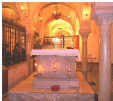
Крипта с мощами св. Николая в Бари

Для христианских святынь в храмах обустроены целые ризницы. Они собраны со всех