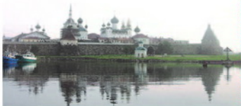
Таким, внезапно выплывшим из тумана предстал перед паломниками Соловецкий монастырь.

Секирная гора. Место, которое вспоминается первым. Необыкновенная тишина, слышно даже комаров, которые здесь поразительных размеров. Замолкает маленькая девочка, только что беззаботно разговаривавшая с мамой. Отойдя немно-