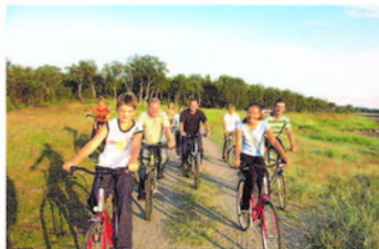
На Соловках и в конце июля—белые ночи. Поэтому паломники успевают все, в том числе велосипедные прогулки.

Да и сама суровая природа Соловецких островов способствует принятию подвига — физического и духовного. Отрезанность от материка 8-9 месяцев в году, холодные ветра, огромные валуны вместо плодородных почв — поистине условия не легче тюремных. Возможно, именно это и способствует аскетическим подвигам, постоянному отсечению своей воли, духовному возрастанию. В таком месте всецело предаёшь себя воле Божией, так как рассчитывать лишь на свои силы не приходится.