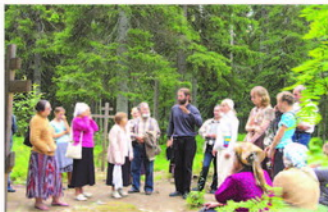
На месте расстрелов, у подножия Секирной горы

Но и суровая северная природа со-творит с Господом и по-особому прославляет его своей строгой красотой. Да, здесь нет комфортных условий, и поэтому приходится приспосабливаться — берёзка не гордо стоит, кланяясь своим стройным станом каждому порыву ветра, а извиваются её ствол