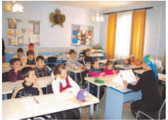
Занятие в Воскресной школе

22 человека в этом году в воскресной школе и вопросов не убавляется ни у детей, ни у родителей. Шесть лет назад в школе было 42 учащихся, ведь сегодня в каждом приходе существует своя «воскреска», не похожая на другие, имеющая свои традиции, свой опыт просвещения. В них ходят наши дети, посещающие светские школы. В этой