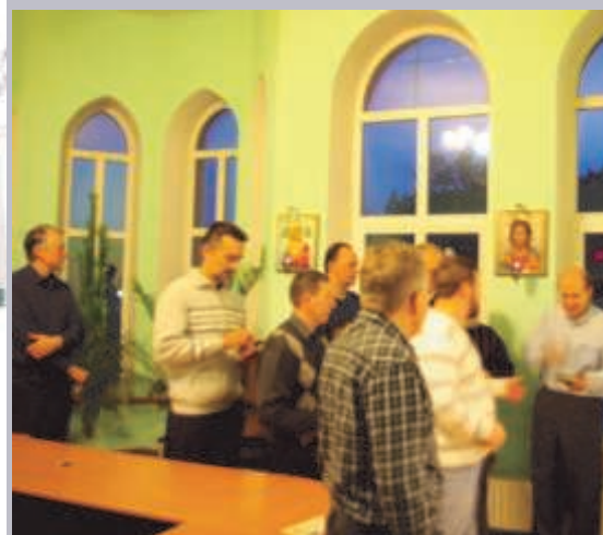
ВЕЧЕРНЯЯ МОЛИТВА В ОТЕЛЕ