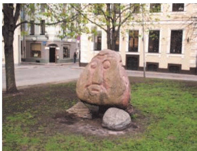
В ЦЕНТРЕ РИГИ

ческие персонажи детских сказок трансформируются в ужасные мистические образы и делаются обыденно привычными через телевидение, кино, модную нынче литературу так называемого стиля "фэнтези". Нередко языческие обряды популяризируются во время народных гуляний. В