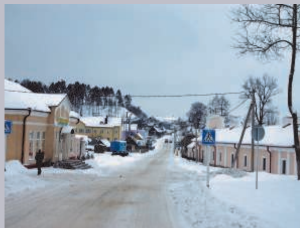
СИМПАТИЧНЫЙ ГОРОДОК ЖИРОВИЧИ КАЗАЛОСЬ ТОЛЬКО И СУЩЕСТВУЕТ, ПОТОМУ ЧТО ЗДРАВСТВУЕТ НАХОДЯЩИЙСЯ В НЕМ ДРЕВНИЙ МОНАСТЫРЬ.