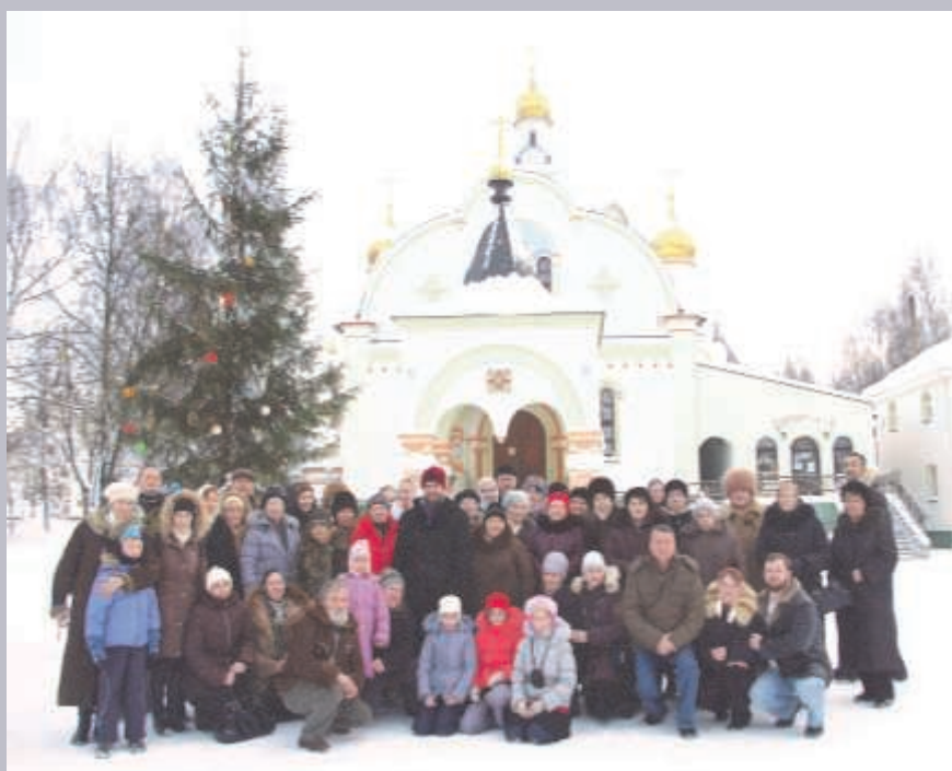
МИНСК. В СВЯТО-ЕЛИСАВЕТИНСКОМ МОНАСТЫРЕ