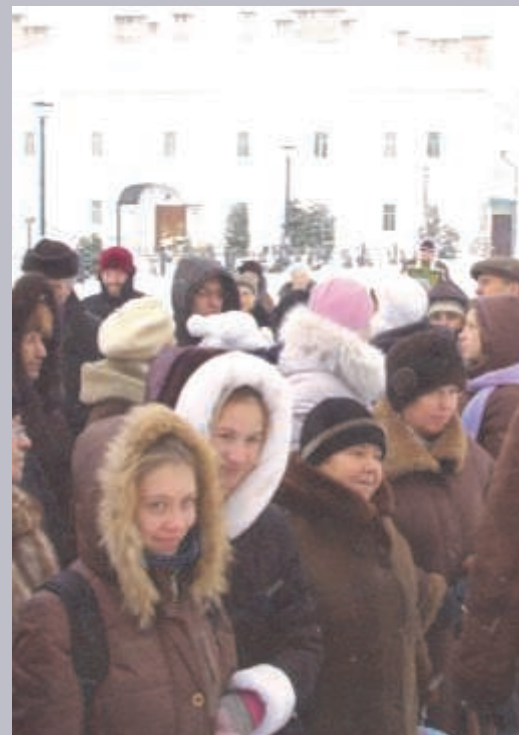
У ПАЛОМНИКОВ ПРЕКРАСНОЕ НАСТРОЕНИЕ