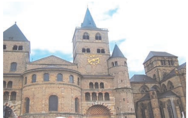
Кафедральный собор Трира, где хранится хитон Господа