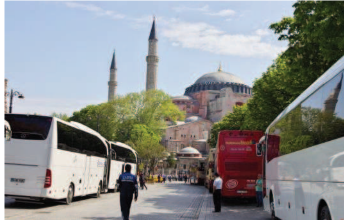
ПЕРВАЯ ОСТАНОВКА — СТАМБУЛ. ХРАМ св. СОФИИ

Первым ярким впечатлением было посещение Стамбула. Так уж была спланирована наша поездка, что мы летели через Турцию, и посещение древнего Константинополя должно было погрузить нас в эпоху раннего христианства. Естественно, главной святыней является Храм Святой Софии. Стамбул - огромный город, мне он показался средоточием чужого непривычного мира. Утром - заунывно-резкое пение муэдзина. Пестрые толпы туристов, в основном из мусульманских стран. Женщины в брюках, но в больших цветастых тюрбанах на голове. Наш гид, яркий представитель страны, удивил косноязычием, большую часть его речи составляли какие-то вводные слова или ничего не значащие фразы. Но все то, что отталкивало своей чуждостью, исчез-