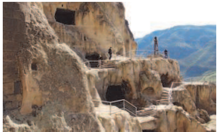
ГОРОД—КРЕПОСТЬ ВАРДЗИЯ. ОБИТЕЛЬ ЦАРИЦЫ ТАМАР

Сохранился Успенский Храм, в прекрасном состоянии фресковая роспись, где я и нашла изображение святой благоверной царицы Тамар, как считается, прижизненное. Ее правление называют "золотым веком"! Господь наделил эту правительницу и премудростью, и кротостью, и трудо-