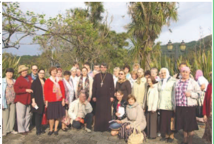
У МОГИЛЫ АП. МАТФИЯ В БАТУМИ

ло, едва мы оказались под сводами Святой Софии. Вот он - главный Храм огромной Византийской империи, больше тысячи лет самый большой Храм в мире. Святая София поразила своими размерами и архитектурными формами. Так, например, купол Храма - нечто выдающееся, он огромен, в диаметре почти 32 метра, в нем прорезано 40 окон, но он легок и кажется, что парит над головой. Внутреннее пространство заполнено арками, окнами и галереями, что также создает впечатление кружевной легкости и воздушности. Сохранились фрески удивительной красоты и проник-