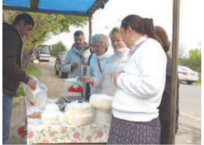
ПРОДАЖА СЫРА И ЧАЧИ В ГРУЗИНСКОЙ ДЕРЕВНЕ

Какая радость, какое духовное утешение, когда мы все, как один, исповедались нашему батюшке и завершили паломничество принятием Святых Тайн в духовном сердце Грузии - древней столице