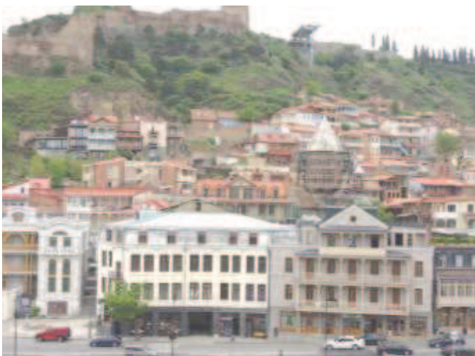
НИКАКОЕ ФОТО НЕ ПЕРЕДАСТ КРАСОТУ ТБИЛИСИ

лись в "настройке" постоянно. Нереально живописные картины природы, необыкновенно вкусная еда, вино, без которого грузины не садятся за стол, сильные впечатления от увиденного, - все это расплывало внимание, создавало ощущение праздника, опьяняло. Но отец Роман не позволял