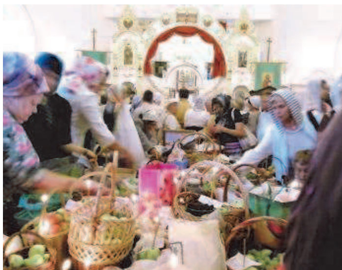
Приятная суeta освящения плодов в Яблочный Спас (праздник Преображения Господня) 19 августа 2012 года