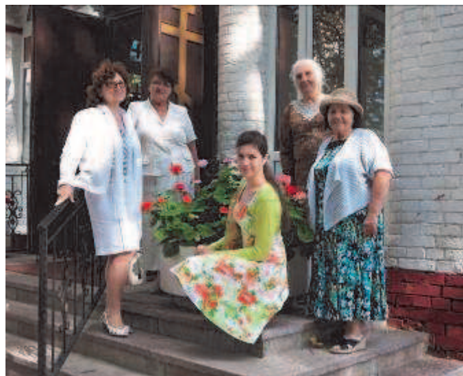
В Престольный праздник всегда хорошее настроение. 29 августа 2011 года.