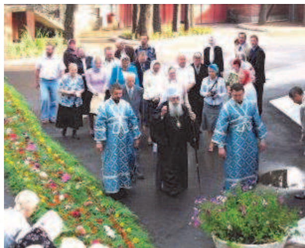
Так встречали в нашем храме митрополита Владимира на Престольный праздник 2006 года