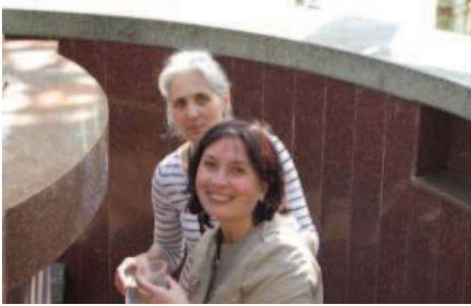
У ЦЕЛЕБНОГО ИСТОЧНИКА В ДОЛИНЕ БОРЖОМИ

Купаться хоть и страшно - нужно обязательно! Иначе зачем я приехала к святой Нино? Первыми купались мужчины. А в рядах слабого пола начались некоторые колебания и сомнения. Кто-то заперевивал из-за своего сердца, кто-то очень боялся судорог. Батюшка почувствовав, что мы нуждаемся в поддержке, встал в нашу колеблющуюся толпу и начал чтение Акафиста святой равноапостольной Нине. Все мигом приободри-