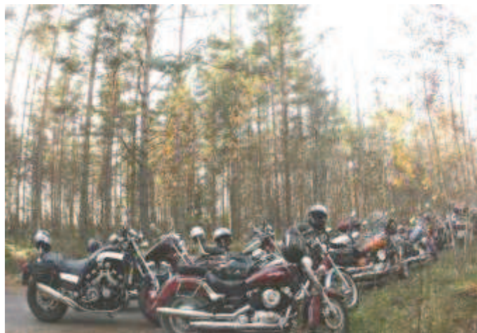
В поисковом движении самые активные — байкеры