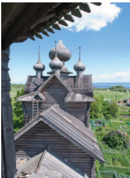
ЦЕРКОВЬ ДМИТРИЯ МИРОТОЧИВОГО

Внутри прибрано, в алтарной части стоит освященный Престол, есть несколько икон. Однако, службы здесь ведутся крайне редко, в деревне очень мало верующих, в основном здесь живут дачники. Для дач и отдыха Щелейки - действительно замечательное место! Немного отдохнув и подкрепившись на берегу Онеги, мы умылись онежской водой и отправились дальше в Гимреку.