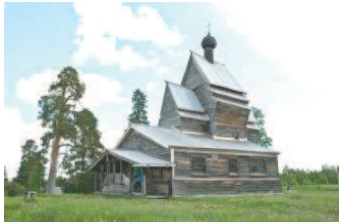
ХРАМ ГЕРОГИЯ ПОБЕДОНОСЦА НА БЕРЕГУ ЮКСОВСКОГО ОЗЕРА

Дорога ведет обратно в Подпорожье и вскоре наша небольшая автоколонна вынырнула из клубов проселочной пыли на асфальт. Вернувшись по уже знакомой дороге через плотину ГЭС, поворачиваем дальше на восток и, некоторое время проплутав по окрестностям, находим подходящее для лагеря место на высоком берегу реки Оять где