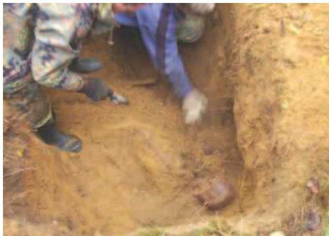
Страшные находки здесь каждым шагом