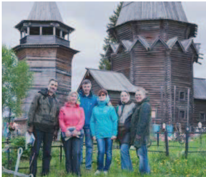
У ХРАМА В ДЕРЕВНЕ СОГИНИЦЫ.

От Важин едем на север, в сторону деревни Согиницы. Асфальт сменился грунтовкой, пришлось увеличить дистанцию, чтобы не поймать в лобо-